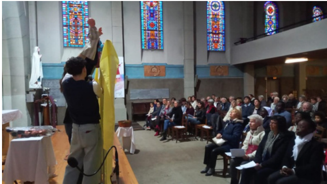
Les jeunes, présentent avec des marionnettes. "Seigneur j'ai le temps" de Michel Quoist.