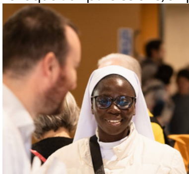
Participant à Hope