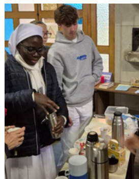
Au Dimanche Pour Tous à ND de Lourdes