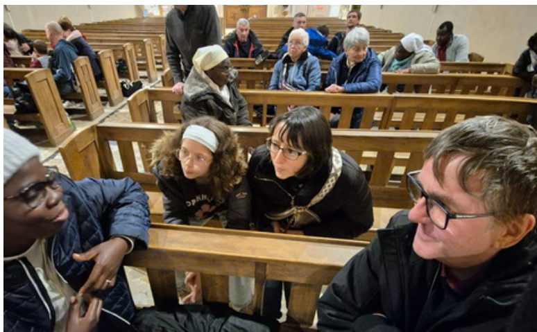
Temps de réflexion et de partage sur le sens de Noël, puis repas partagé