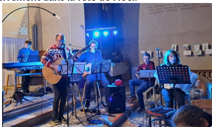
Conte de Noël en chansons