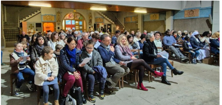
C'était une première à Notre Dame de Lourdes