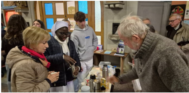
accueillis par un café à l'entrée de l'église