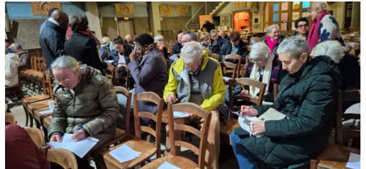
Quel temps je consacre dans ma semaine, à ma famille - au travail / aux études - aux autres - à Dieu - à moi ?... Puis on échange à plusieurs

Du côté des enfants : Nous nous sommes retrouvés nombreux, enfants et parents, anciens et nouveaux, caté et éveil à la foi pour partager autour du thème du Temps. Nous avons échangé avec les enfants à partir de photos sur ce qu'évoquait pour eux le temps pour chaque chose de la vie quotidienne, le temps agréable ou le temps impose, celui qui passe au fil des années et celui que nous consacrons Dieu. A partir de ces constatations, nous avons construit ensemble une horloge (photo) pour nous indiquer le temps tout au long de cette année.