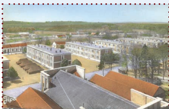
Le camp d'Auvours, en peinture.

Invité par Léon Bollée, constructeur automobile, le pilote américain Wilbur Wright profitera lui aussi de ces infrastructures pour abriter ses avions et lancer 120 vols. Devant 15 000 spectateurs à l'époque, il bat neuf records du monde et 17 internationaux. Ce sont les moments de gloire du terrain d'Auvours.