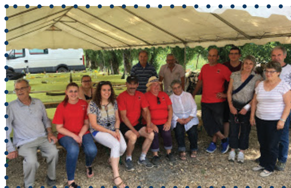
Une partie des membres du comité des fêtes

La nouvelle Présidente se félicite de l'arrivée de nouveaux jeunes membres porteurs de projets qui seront discutés lors de prochaines réunions.