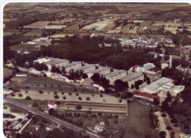
Le camp d'Auvours, vue aérienne.

Avant que le 2 e Régiment d'infanterie de marine (RIMa) ne débarque au Mans, à son retour d'Algérie en août 1963, Auvours sert de base à l'École d'application d'infanterie (1946). Les militaires s'entraînent aux combats de première ligne. Lors du retour en métropole du 2 e RIMa, une partie prend ses quartiers à Champagné, l'autre à la caserne Chanzy au Mans. Jusqu'en 1976-1977, où l'ensemble du régiment, qui devient professionnel, est regroupé à Auvours. Depuis, le 2 e RIMa compte dans ses rangs plus de 1 100 hommes et femmes, régulièrement envoyés sur les théâtres de guerre où l'armée française est engagée.