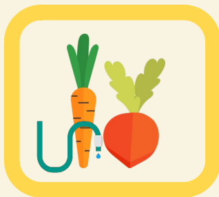
Arrosage des jardins potagers