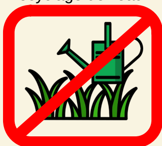
Arrosage des pelouses