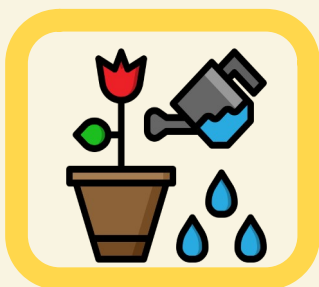
Arrosage des fleurs et massifs fleuris