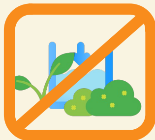
Alimentation des plans d'eau et biefs sauf hydroélectricité **