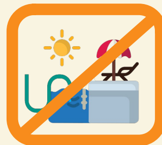
Remplissage et vidange des piscines privées ***