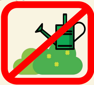
Arrosage des espaces verts ****