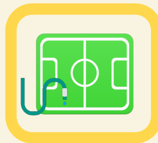
Arrosage des terrains de compétition engazonnés