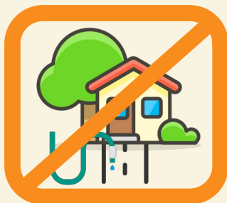
Nettoyage des façades, toitures, trottoirs sauf collectivité ou professionnels