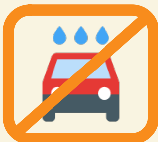
Sauf en station pour les lavages via lances à haute-pression et les portiques équipés de recyclage de l'eau*